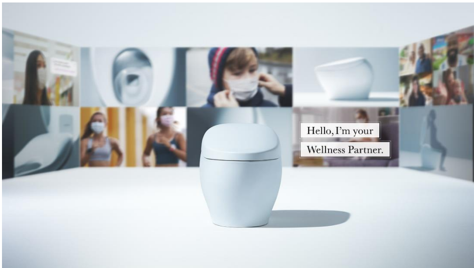
CES2021 TOTOのキービジュアル

TOTOは、1917年の創立以来、トイレなど水まわり設備機器メーカーとして100年に渡って取り組んできた、衛生・清潔・快適な生活に貢献する技術革新を世界に広めていくことを、「TOTO CLEANOVATION」のメッセージで訴求します。さらに、今回“健康”という新たな生活価値創造をめざすウェルネストイレの取り組みを初表明し、出展コンセプトを「Hello, I'm your Wellness Partner.」としました。