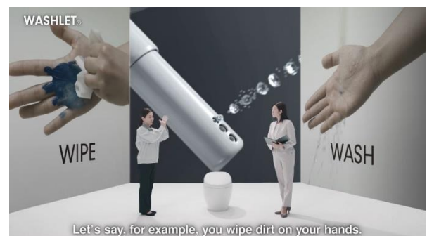
CES2021 プレゼンテーション動画より

そして、おしりを洗う技術への拘り——少ない水でも強くたっぷりした洗い心地を実現する「エアワンダーウェーブ洗浄」や、トイレを快適に過ごすための暖房便座や脱臭機能などを紹介します。