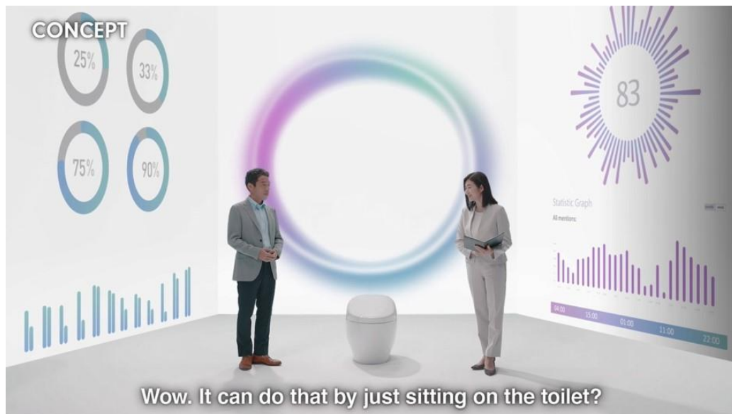
CES2021 プレゼンテーション動画より

2017年に創立100年を迎えたTOTOは、次の100年も業界をリードし続けるため、デジタルイノベーションを積極的に進めていきます。TOTOは、オープンイノベーションで世界中のスタートアップ企業や研究機関と連携し、全く新しい水まわり商品の開発を進めています。