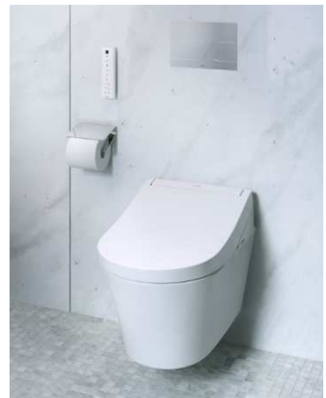
壁掛け大便器 GP WASHLET RG *2021年夏以降発売予定(日本市場除く)

今回のISHではお客様に実際の商品を触っていただくことはできませんが、360度デジタルコンテンツで、お客様の好きな角度から商品の形状を見ながら、さまざまな搭載機能をご確認いただけます。