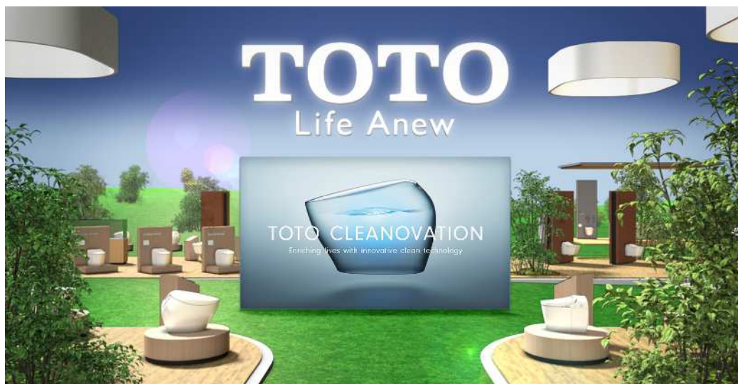
ISH2021 TOTOのデジタルブース(イメージ)

商品紹介では、デザインとテクノロジーの高度な融合により、海外のバスルーム空間にもマッチする最新水まわり商品を出展します。TOTOのトイレの最高峰であるウォシュレット一体形便器「ネオレスト」や、「壁掛け大便器 GP+ウォシュレット RG」「自動水栓」などの新商品を発表します。また、デジタルならではの3Dウォークスルーで、実際のブースにいる感覚を体感していただけます。デザインとテクノロジーが高度に融合した商品によって構成される、TOTOが提案する住宅空間とホテル空間をお楽しみください。