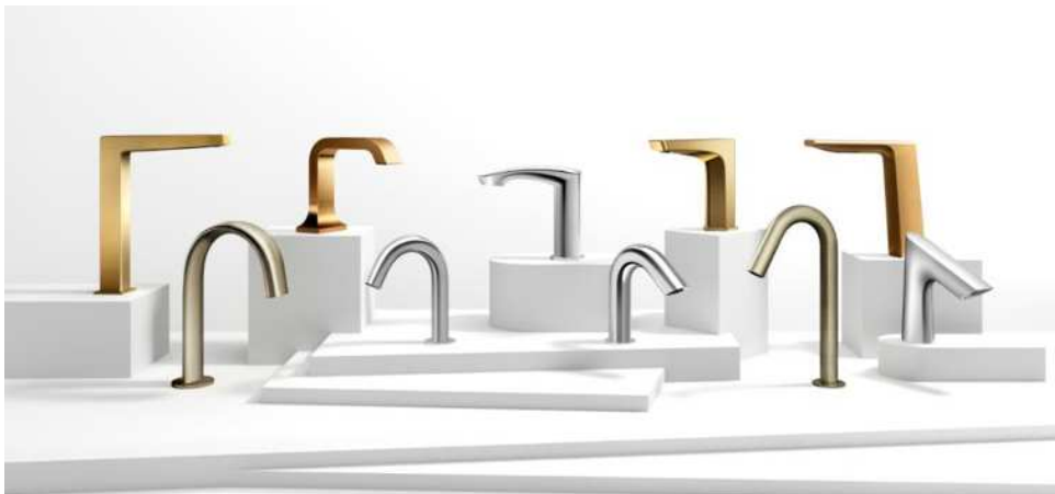
自動水栓 グローバル統一モデル *2021年春以降発売予定(一部商品は日本市場除く)

今回は自動水栓10シリーズとデザインを合わせたオートソープディスペンサー3シリーズ(丸形/角形/グースネック)を、これらにマッチした洗面器と共に、洗面空間トータルで提案します。